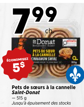
7 99 ch. Pets de sœurs à la cannelle Saint-Donat - 515 g Jusqu'à épuisement des stocks