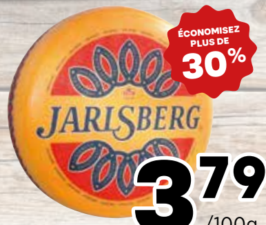
3 79 /100g Fromage Jarlsberg - 17,19$/lb