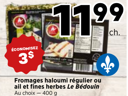
11 99 ch. Fromages haloumi régulier ou ail et fines herbes Le Bédouin Au choix - 400 g