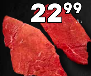
22 99 /lb Escalopes de veau de grains du Québec 50,68$/kg

Découvrez nos viandes, charcuteries et poissons. Jusqu'à épuisement des stocks. Promotions valides du 12 au 18 mars.