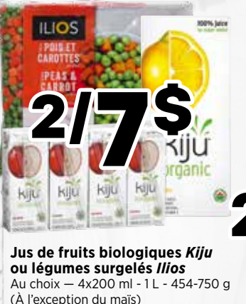
2/7$ Jus de fruits biologiques Kiju ou légumes surgelés Ilios Au choix - 4x200 ml - 1 L - 454-750 g (À l'exception du maïs)