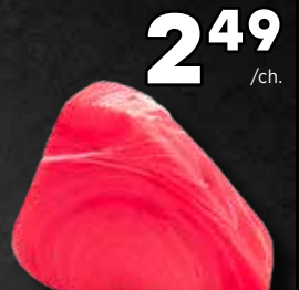
2 49 /ch. Darne de thon