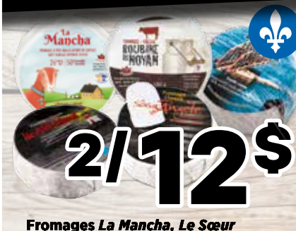
2/12$ Fromages La Mancha, Le Sœur Angèle, Roubine de Noyan, Le Pont Tournant ou Ile-Ash-Island Au choix - 180 g