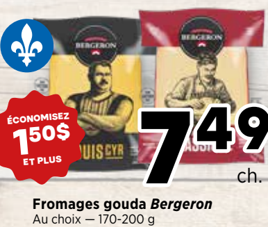
7 49 ch. Fromages gouda Bergeron Au choix - 170-200 g