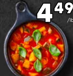
4 49 /lb Soupe aux légumes - Produit maison 9,90$/kg