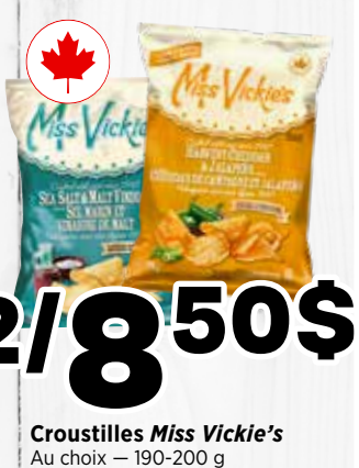
2/8 50 $ Croustilles Miss Vickie's Au choix - 190-200 g