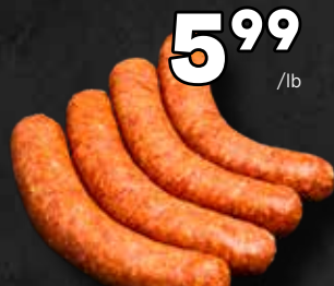
5 99 /lb Saucisses de porc au sirop d'érable 13,21$/kg