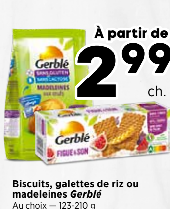
2 99 ch. Biscuits, galettes de riz ou madeleines Gerblé Au choix - 123-210 g