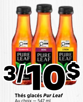
3/10$ Thés glacés Pur Leaf Au choix - 547 ml