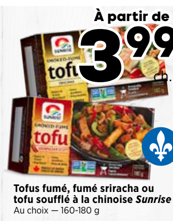
3 99 ch. Tofus fumé, fumé sriracha ou tofu soufflé à la chinoise Sunrise Au choix - 160-180 g