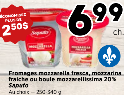
6 99 ch. Fromages mozzarella fresca, mozzarina fraîche ou boule mozzarellissima 20% Saputo Au choix - 250-340 g