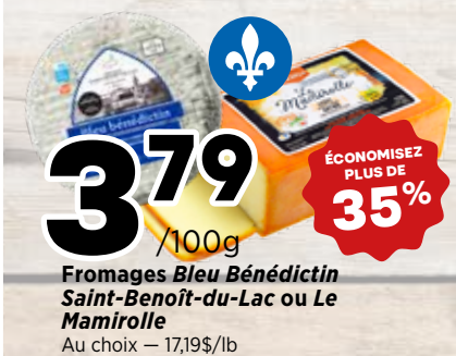
3 79 /100g Fromages Bleu Bénédicтин, Saint-Benoît-du-Lac ou Le Mamirolle Au choix - 17,19$/lb