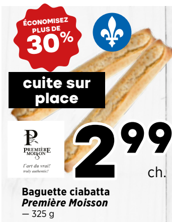
2 99 ch. Baguette ciabatta Première Moisson - 325 g