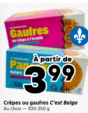
3 99 ch. Crêpes ou gaufres C'est Belge Au choix - 300-350 g