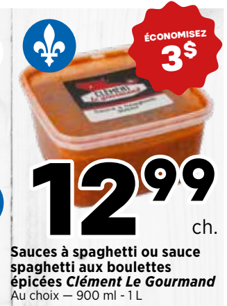
12 99 ch. Sauces à spaghetti ou sauce spaghetti aux boulettes épicées Clément Le Gourmand Au choix - 900 ml - 1 L