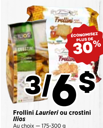
3/6$ Frollini Laurieri ou crostini Ilios Au choix - 175-300 g