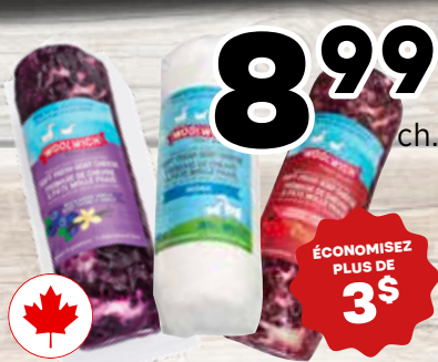
8 99 ch. Fromages de chèvre frais Woolwich Au choix - 300 g