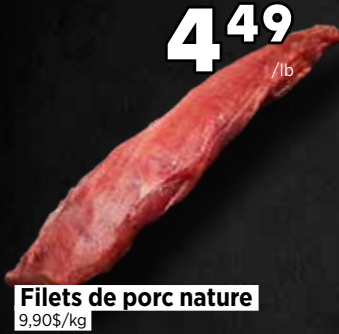
Filets de porc nature 9,90$/kg

Découvrez nos viandes, charcuteries et poissons. Jusqu'à épuisement des stocks. Promotions valides du 5 au 11 mars.