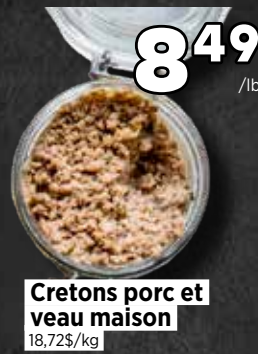
Cretons porc et veau maison 18,72$/kg