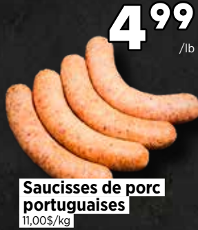
Saucisses de porc portugaises 11,00$/kg