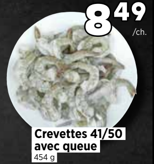
Crevettes 41/50 avec queue 454 g